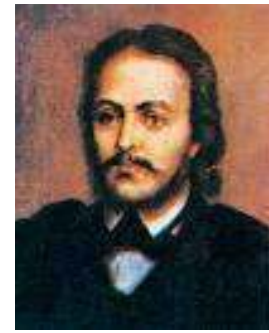
Gheorghe Lazăr întemeietorul învățământului matematic românesc